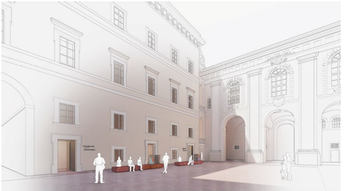
Visualisierung des Eingangsbereiches zum Besucherzentrum.