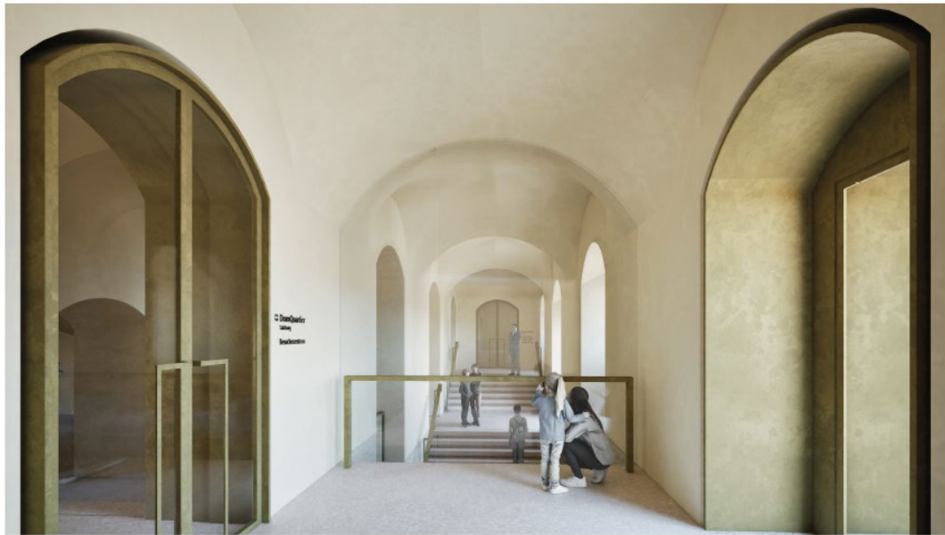
Visualisierung des Eingangsbereiches sowie des neuen Treppenhauses.

Gewölbe und räumliche Schichten werden sichtbar gemacht, um die Baugeschichte des Gebäudes zu verdeutlichen.