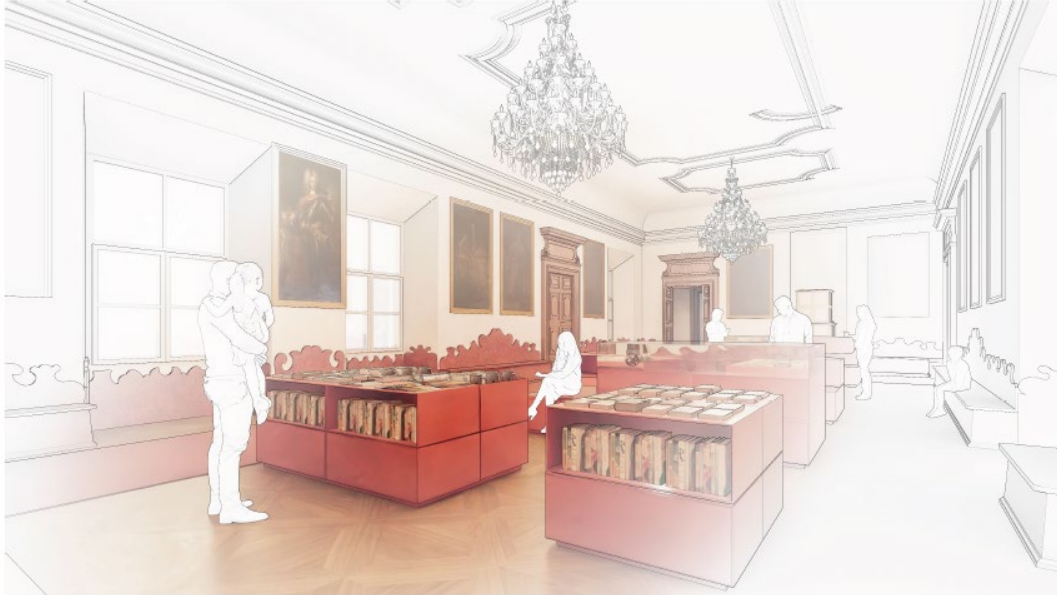
Visualisierung des Kaisersaals.